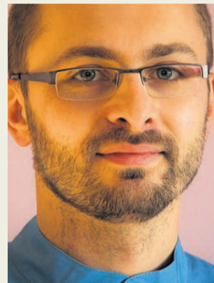
Pacjenci Ciesielki nie boją się dentysty – i jest w tym jego wielka zasługa. Choć sam przyznaje, że każdy z nas

Z zegarmistrzowską precyzją wykonuje swoją pracę. Staranny i dokładny. Stomatolog artysta, „remontuje” zęby z niezwykłą finezją. Dlatego coraz większą popularność zdobywa zwłaszcza wśród pacjentek. Do wesołego, uśmiechniętego górala ze Szczawnicy przyjeżdżają panie nawet z Krakowa.