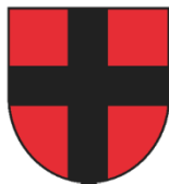
MIASTO I GMINA DĄBROWA TARNOWSKA