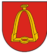
MIASTO I GMINA SZCZUCIN